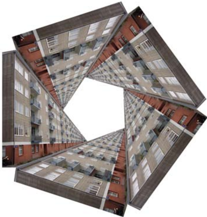
BARONIE STRAAT WOONBLOK VARIATIE 5