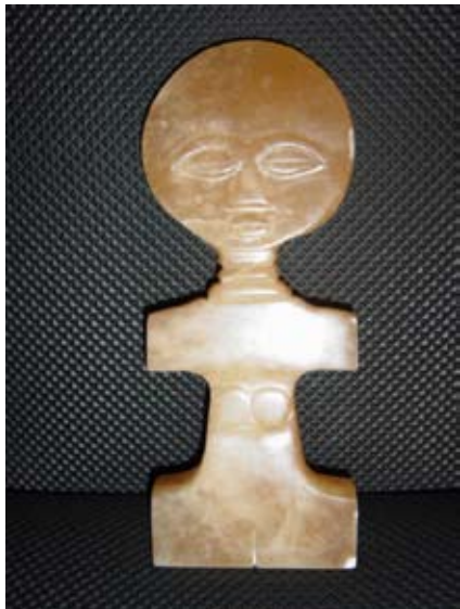
ANDRÉ BROOS ASHANTI FIGURE