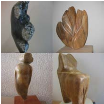
YVONNE DE BOER - DE COCK VOORJAAR EN MEER