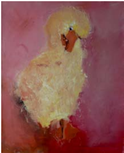
OLGA GRÜTTERS PLEASE DO NOT GAK