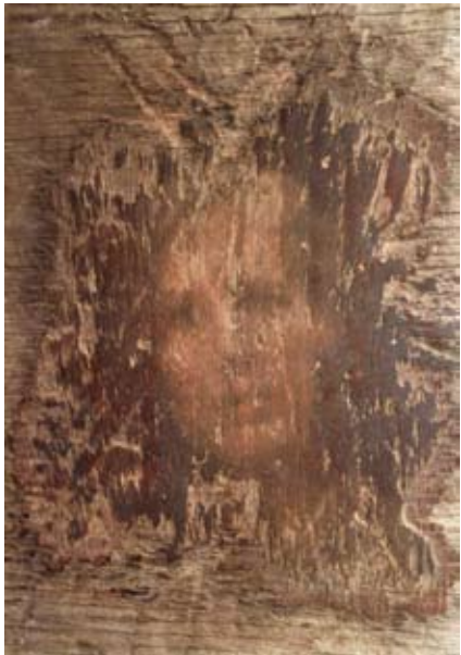
NIKI FRÖHLING SELFPORTRAIT