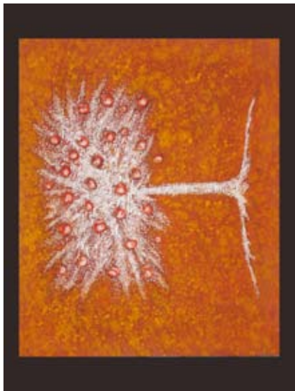
AMOS VAN GELDER TREE OF WORDS