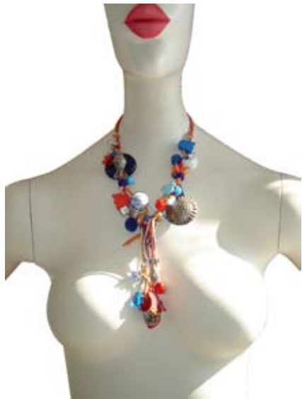
BY MARIA DUTCH DUBBEL DUTCH ART BYOUX