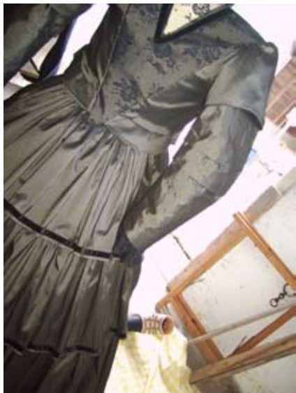
JUNS DE HAAS NIEUWE VORMEN